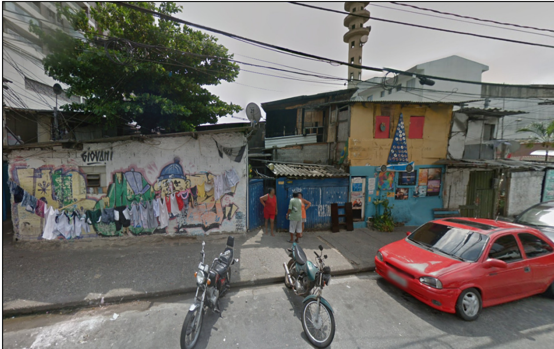
(Vista da frente da localização do terreno, voltada à Rua Senador Feijó)