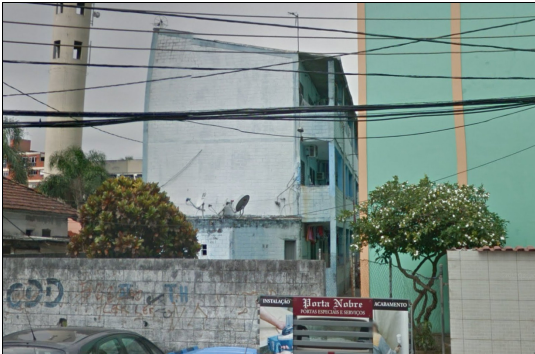
(Vista da localização do terreno, voltada à Rua Comendador Martins)