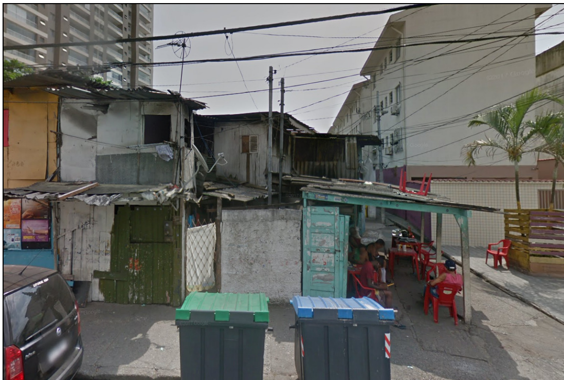
(Vista da localização do terreno, voltada à Rua Senador Feijó)